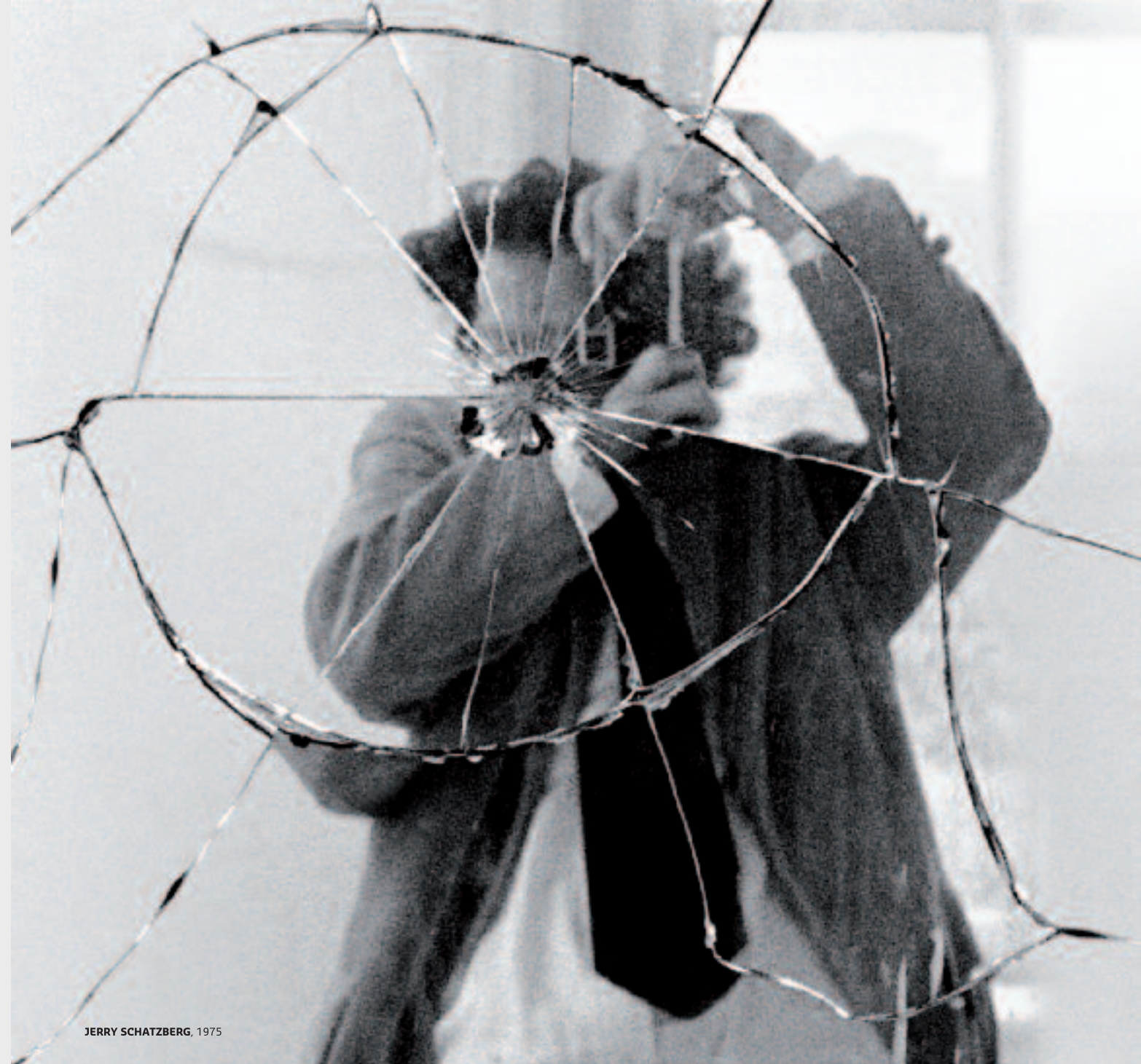
JERRY SCHATZBERG, 1975